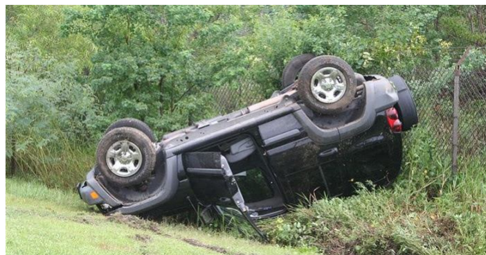
A segurança dos veículos desempenha um papel crucial na redução da gravidade dos ferimentos e fatalidades

Algumas vidas podem ser salvas com atendimento oportuno no local, transporte imediato ao hospital para atendimento de emergência e cirúrgico e acesso antecipado a serviços de reabilitação. Analogamente, os “espectadores” podem ajudar a salvar vidas, activando o sistema de atendimento de Emergência e realizando acções simples de atendimento até que a ajuda médica profissional chegue ao local das vítimas.