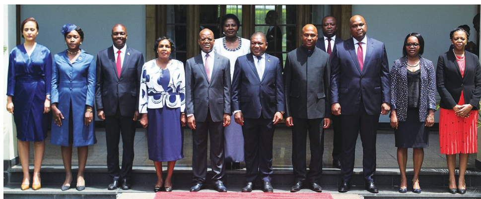
Secretários de Estado posam com o Presidente da República após a tomada de posse

O CDD que apresenta-se com a missão de facilitar análises estratégicas e catalisar o desenvolvimento de capacidades para uma democracia sustentável em Moçambique, lembra que quando os Governadores de Província e os Secretários de Estado na Província tomaram posse, iniciou um debate sobre como seria feita a partilha de recursos humanos, patrimoniais e financeiros pelos dois órgãos. “Os amplos poderes executivos atribuídos à figura de Secretário de Estado na Província demandam a existência de uma estrutura de suporte mais ou menos à semelhan-