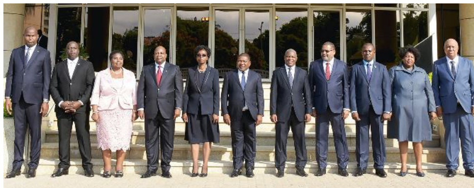
Governadores Provinciais posam com o Presidente da República após a tomada de posse

“Entretanto, o CDD apurou que a comissão interministerial presidida pelo Ministério da Administração Estatal e Função Pública ainda não concluiu o trabalho de divisão de bens e de produção de estruturas orgânicas, pelo que os Governadores da Província, eleitos por sufrágio universal, continuam proibidos de tomar decisões estruturantes e sem meios para começar a trabalhar”.