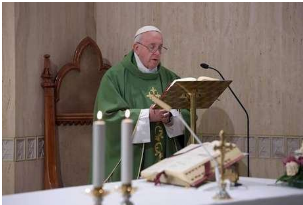
Papa diz que políticos sem sabedoria prejudicam a sociedade

co no olho de seu irmão e não se lembra do que está no seu?" – questionou Francisco ressaltando que "é mais fácil e confortável condenar os defeitos dos outros, sem ser capaz de se ver com a mesma lucidez".