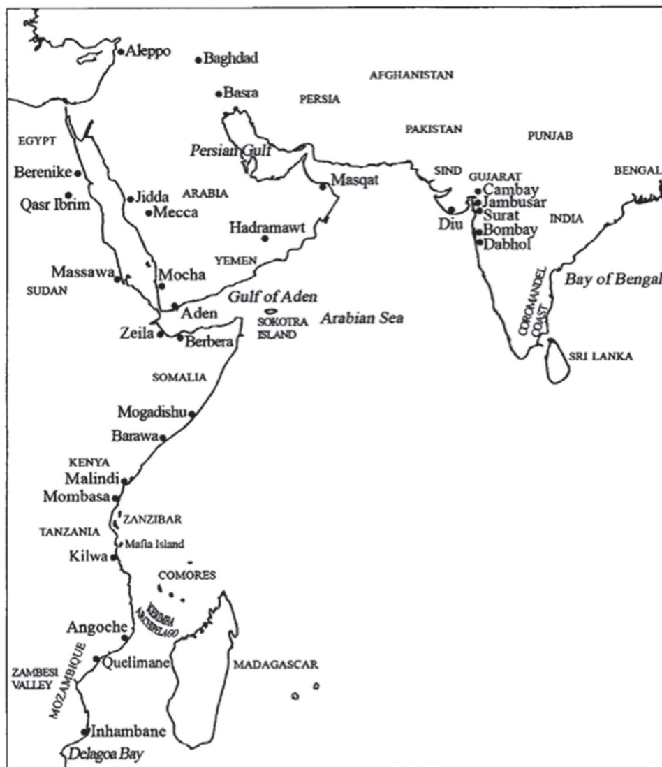
Map 8.1. Areas of cotton textile trade in the western part of the Indian Ocean