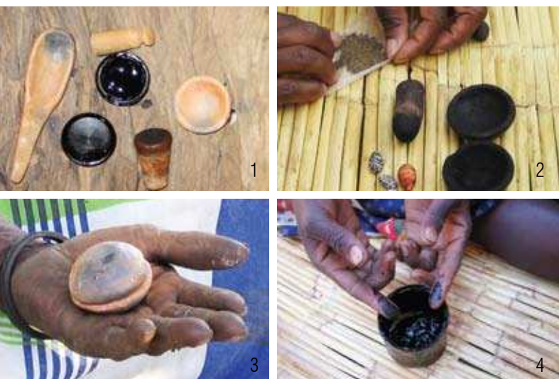
1. Os instrumentos utilizados para preparar e conservar o óleo para alongar os pequenos lábios | 2. Pó usado para inserir na vagina: grãos de ntenguene e de rícino moídos em dois pequenos recipientes de barro ( mbale ) para preparar o óleo destinado a alongar os pequenos lábios | 3. O mbale é constituído por dois pequenos recipientes de barro, onde se conserva o óleo para alongar os pequenos lábios | 4. Uma mulher unta os indicadores das mãos com o medicamento que usa para alongar os pequenos lábios

A pesquisa quantitativa foi realizada em toda província em 2008 através de um inquérito aos agregados familiares (AF). O questionário incluía dados sobre as características sócio-demográficas e aspectos relevantes da saúde reprodutiva. A selecção dos agregados familiares e da entrevistada no agregado seguiu uma amostragem em varias etapas. De uma lista de 52 áreas de enumeração representativa da província, 34 áreas foram seleccionadas. Em cada área, 30 AFs foram seleccionados aleatoriamente utilizando uma lista actualizada de AFs. As mulheres entrevistadas também foram escolhidas aleatoriamente de entre as mulheres elegíveis no AF. 919 mulheres entre 18 e 60 anos foram entrevistadas, representando uma taxa de resposta geral de 89,7%.