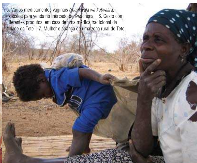
5. Vários medicamentos vaginais ( mankwala wa kubvalira ) expostos para venda no mercado de Kwachena | 6. Cesto com diferentes produtos, em casa de uma médica tradicional da cidade de Tete | 7. Mulher e criança de uma zona rural de Tete

Prevalência das práticas vaginais: 78,9% das mulheres estava no momento da pesquisa a utilizar três ou mais práticas. O tratamento vaginal representava uma parte normal da vida das mulheres. 97,1% das mulheres já tinham tido as três ou mais práticas vaginais. Limpeza intravaginal (92,2%) e alongamento dos pequenos lábios vaginais (98,6%) são universais. A inserção de substâncias na vagina e lavagem externa são adoptadas por 71,6% e 70,1% respectivamente. 47,6% das entrevistadas mencionam a ingestão de substâncias que afectam a vagina, enquanto 24,7% afirmam ter realizado o corte ou uma incisão pelo menos uma vez na vida. A aplicação de substâncias na vagina (16,3%) e, ou na genitália, incluindo vapor ou fumo (14,6%) é menos frequente.