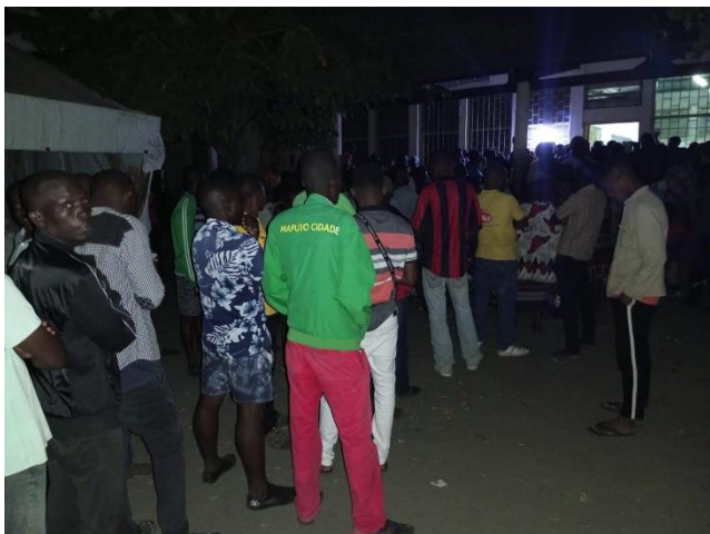
Posto de recenseamento na Cidade da Beira

Em Nampula também houve postos encerrados antes das zero horas, devido à falta de corrente eléctrica e a avarias de equipamento. A técnica usada em Nampula para impedir o recenseamento de eleitores da oposição foi o corte de fornecimento de energia e restabelecimento tardio, quando muita gente já tinha desistido.