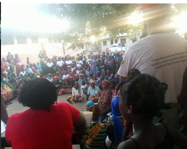
Foto de posto de recenseamento em Angoche