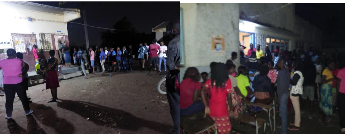
As fotos ilustram cidadãos desesperados nas filas na Beira no último dia do censo eleitoral

Em muitos postos dos distritos dominados pela oposição, no centro e norte de Moçambique, os postos de recenseamento encerraram entre às 17 e às 21 horas, porque a EDM ordenou interrupções, em série, de corrente eléctrica e os directores distritais dos STAE mandaram decretar avarias de computadores. Em Sofala, houve reforço de contingente policial nos postos que ainda recenseavam, mas as máquinas avariavam constantemente.