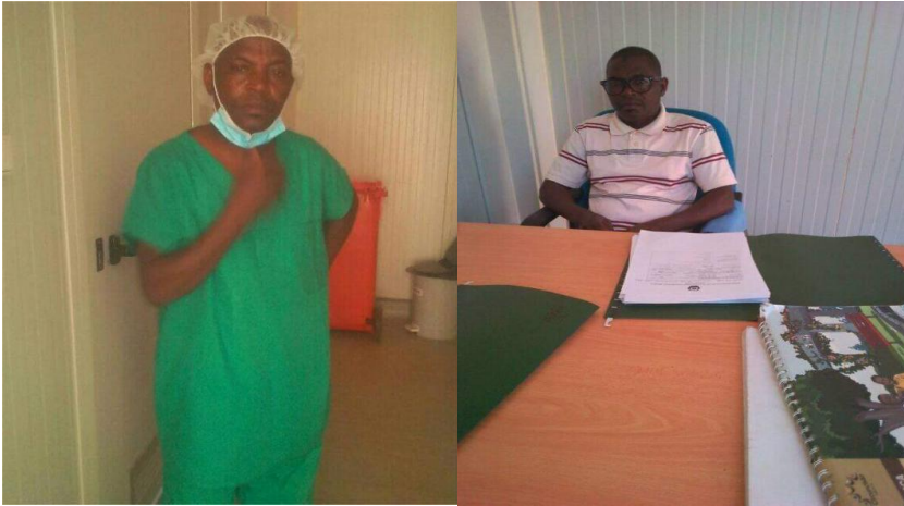
Fotos do funcionário transferido por acomodar apoiantes de Venâncio Mondlane

Renamo impedido de fazer campanha em Marávia. No distrito de Marávia, em Tete, o cabeça de lista da Renamo escalou a localidade de Uncanha, no posto administrativo de Malowera, mas não conseguiu fazer o seu trabalho por causa da agitação provocada pelo partido no poder. Foi obrigando a abandonar a localidade em direcção a Zumbo.