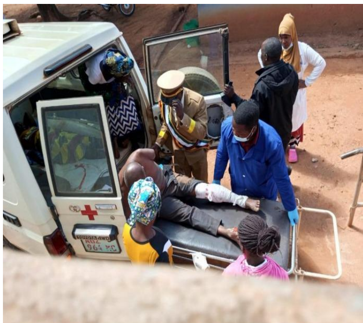
Viatura transportando vítima do acidente em Sussundega

A segunda semana de campanha eleitoral foi marcada por três acidentes de viação que resultaram em dois mortos e mais de 100 feridos. Os dois primeiros ocorreram na segunda-feira, em Sussundega, província de Manica, e causaram um morto e cerca de uma dezena de feridos. O segundo foi na quarta-feira (4/9), no Rio Mulongozi, em Milange, província da Zambézia. Todos envolveram viaturas transportando membros da Frelimo para reforçar a campanha eleitoral do seu candidato, Daniel Chapo.