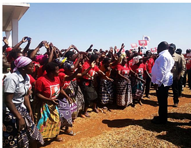
Imagem: Filipe Nyusi durante campanha eleitoral em Milange, Zambézia

membros e simpatizantes do seu partido e por uma comitiva de membros saídos do distrito de Namacurra para o evento. No mesmo dia, Nyusi orientou um comício na sede da Frelimo em Nicoadala para uma centena de membros e simpatizantes trajados de camisetas vermelhas.