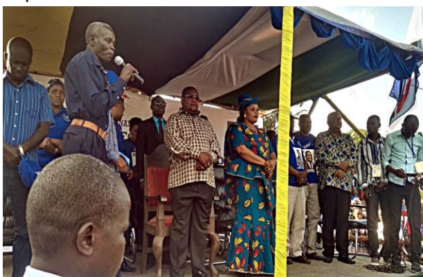
Imagem: Ossufo Momade durante campanha eleitoral em Quelimane, Zambézia

No outro extremo, o candidato da Renamo, Ossufo Momade acompanhado da sua esposa, fez o lançamento da campanha do seu partido na Zambézia no dia 3 de Setembro, tendo regressado no dia seguinte a Maputo. O candidato chegou ao aeroporto de Quelimane por volta das 16h e foi recebido pelo cabeça-de-lista e outros membros e simpatizantes.