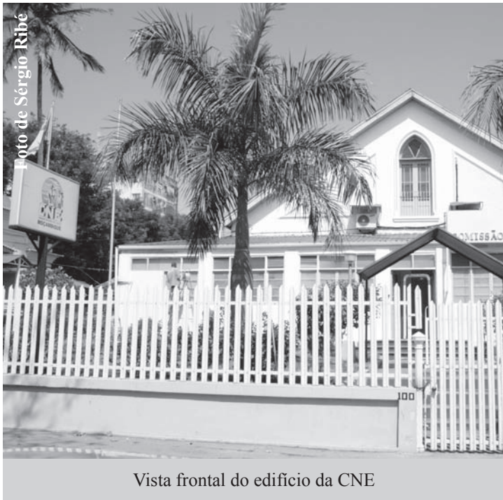
Vista frontal do edifício da CNE