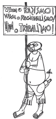
FIGURA 1 — Xiconhoca, o tribalista, racista e regionalista

No seu conjunto, as mensagens éticas e políticas que esta figura emblemática do inimigo encerrava transformaram-se rapidamente na marca dos comportamentos a evitar, sob risco de se ser penalizado pela mão implacável da justiça popular, que punia os “moçambicanos que pelas suas ideias, pelo seu comportamento, pela sua actuação, servem objectivamente os interesses do inimigo imperialista e comprometem o desenvolvimento do processo revolucionário no nosso País” (Frelimo, 1979: 2), como alguns exemplos expõem.