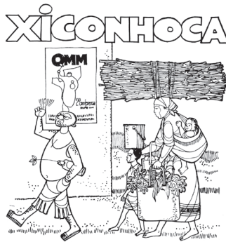
FIGURA 3 — Xiconhoca é contra a emancipação da mulher

A reforma do Estado, proposta pela Frelimo a partir das experiências de democratização participativa das zonas libertadas, contrastava com o peso das representações burocráticas coloniais. O III Congresso da Frelimo (1977) constitui uma afirmação importante quanto às orientações relativas à administração do território e à natureza do Estado. Estabelecida a necessidade imperiosa de combater os resquícios das mentalidades coloniais, as decisões do congresso incluíam a “necessidade de completar a destruição do aparelho de Estado colonial-capitalista [...] acelerando a criação de novos órgãos do Poder estatal a nível do distrito e da localidade” (Frelimo, 1977b).