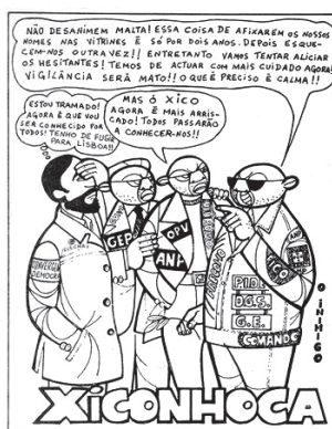
FIGURA 6 — Xiconhoca, o comprometido

Num plano mais amplo, os jornais da altura denunciavam as situações de especulação de produtos básicos alimentares, desmascarando igualmente situações de açambarcamento. Não é de estranhar que as imagens do Xiconhoca se associassem, nos média, a peças jornalísticas que denunciavam a realidade de uma economia paralela, que desafiava o projeto económico que promovia a (re)produção do ‘homem novo’. As tentativas de fuga a um regime de preços fixados pelo Governo, a falta de alimentos fruto da fraca produção, associada às carências resultantes do bloqueio económico regional geraram uma economia paralela, que o regime punia com mão forte, incluindo penas físicas (chicotadas) ou mesmo a pena de morte. 57