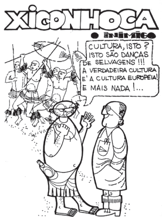
FIGURA 4 — Xiconhoca, o inimigo da cultura moçambicana