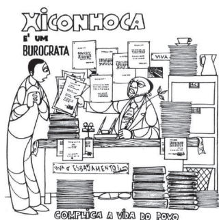
FIGURA 2 — Xiconhoca, o burocrata

No Moçambique recém-independente o risco de fraturas de classe, étnico-regionais ou raciais era enorme. Neste contexto, as declarações sobre a natureza do inimigo contribuíam para delinear com precisão as fronteiras morais do Estado e do povo. A figura do Xiconhoca revela que a relação entre o povo – o coletivo dos ‘novos’ cidadãos – e a Frelimo, que o liderava, assentou no delinear de uma configuração de pertença e exclusão assertiva, procurando ultrapassar os problemas herdados do tempo colonial. Como Alice Dinerman sublinha, na análise da denúncia que esta personagem simbolizava, a Frelimo buscou ampliar o seu apoio popular, denunciando características identitárias negativas específicas, como o racismo, o tribalismo ou o regionalismo, ou ainda contra ideologias mistificadoras que desafiavam a proposta da Frelimo, como o liberalismo, o populismo, ou o esquerdismo (2006: 70). Na primeira década da independência, era praticamente impossível falar de diferenças sociais para além das diferenças óbvias entre colonizadores e povos oprimidos, entre ricos e pobres, etc. Referências a outras formas de diferença – fossem de natureza cultural ou mesmo étnica – eram condenadas como promotoras de regionalismo e de ações tribalistas, como ameaças à integridade da nação.