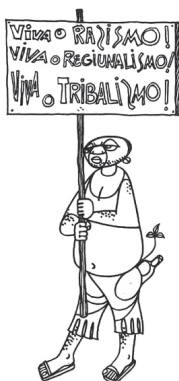
FIGURA 1 — Xiconhoca, o tribalista, racista e regionalista

No seu conjunto, as mensagens éticas e políticas que esta figura emblemática do inimigo’ encerrava transformaram-se rapidamente na marca dos comportamentos a evitar, sob risco de se ser penalizado pela mão implacável da justiça popular, que punia os “moçambicanos que pelas suas ideias, pelo seu comportamento, pela sua actuação, servem objectivamente os interesses do inimigo imperialista e comprometem o desenvolvimento do processo revolucionário no nosso País” (Frelimo, 1979: 2), como alguns exemplos expõem.