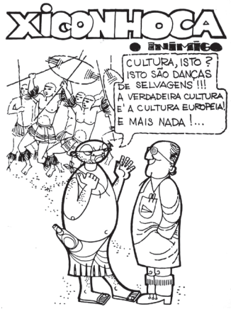
FIGURA 4 — Xiconhoca, o inimigo da cultura moçambicana