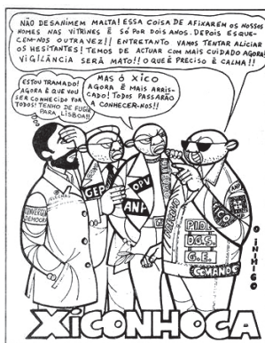
FIGURA 6 — Xiconhoca, o comprometido

Num plano mais amplo, os jornais da altura denunciavam as situações de especulação de produtos básicos alimentares, desmascarando igualmente situações de açambarcamento. Não é de estranhar que as imagens do Xiconhoca se associassem, nos média, a peças jornalísticas que denunciavam a realidade de uma economia paralela, que desafiava o projeto económico que promovia a (re)produção do ‘homem novo’. As tentativas de fuga a um regime de preços fixados pelo Governo, a falta de alimentos fruto da fraca produção, associada às carências resultantes do bloqueio económico regional geraram uma economia paralela, que o regime punia com mão forte, incluindo penas físicas (chicotadas) ou mesmo a pena de morte. 57