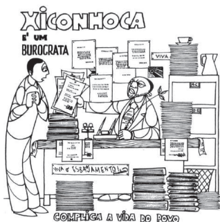
FIGURA 2 — Xiconhoca, o burocrata

No Moçambique recém-independente o risco de fraturas de classe, étnico-regionais ou raciais era enorme. Neste contexto, as declarações sobre a natureza do inimigo contribuíam para delinear com precisão as fronteiras morais do Estado e do povo. A figura do Xiconhoca revela que a relação entre o povo – o coletivo dos ‘novos’ cidadãos – e a Frelimo, que o liderava, assentou no delinear de uma configuração de pertença e exclusão assertiva, procurando ultrapassar os problemas herdados do tempo colonial. Como Alice Dinerman sublinha, na análise da denúncia que esta personagem simbolizava, a Frelimo buscou ampliar o seu apoio popular, denunciando características identitárias negativas específicas, como o racismo, o tribalismo ou o regionalismo, ou ainda contra ideologias mistificadoras que desafiavam a proposta da Frelimo, como o liberalismo, o populismo, ou o esquerdismo (2006: 70). Na primeira década da independência, era praticamente impossível falar de diferenças sociais para além das diferenças óbvias entre colonizadores e povos oprimidos, entre ricos e pobres, etc. Referências a outras formas de diferença – fossem de natureza cultural ou mesmo étnica – eram condenadas como promotoras de regionalismo e de ações tribalistas, como ameaças à integridade da nação.