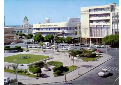
Vista parcial da Praça do Município, no coração da cidade, na década de 1960