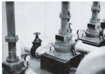
Estação Elevatória n.º2: vista interior do 1º Piso com as bombas maiores e uma das menores