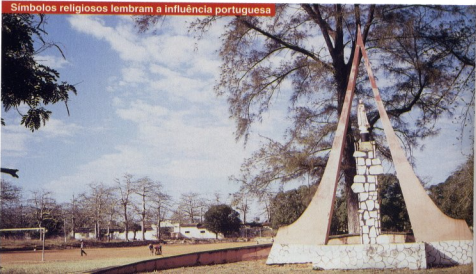
Símbolos religiosos lembram a influência portuguesa

O pôr-do-sol em qualquer parte de África é uma experiência inesquecível, mas em Pemba, por entre os embondeiros, é duma rara beleza, escondendo-se sobre as águas límpidas do oceano e a areia branca da praia orlada de coqueiros. Férias de sonho? Sem dúvida Pemba!