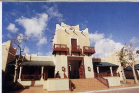
Hotel Pemba Beach